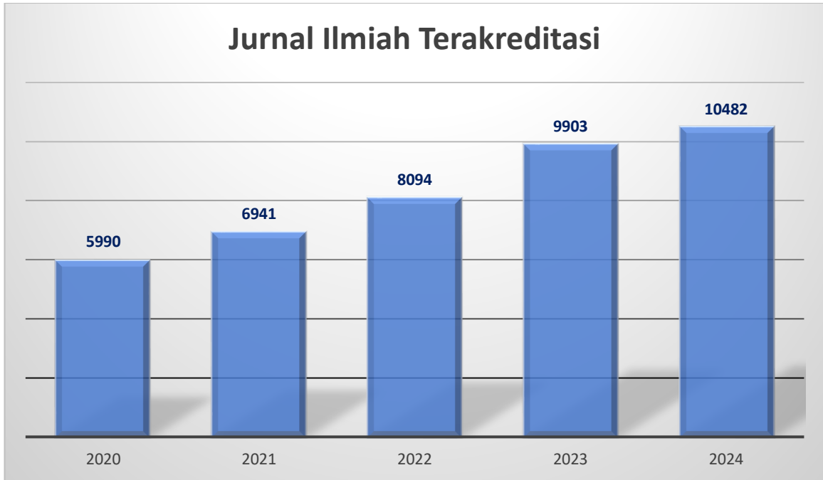
Gambar 1 Jumlah jurnal terakreditasi 2021 sampai 2024