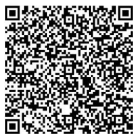
Pedoman dan Materi Sosialisasi