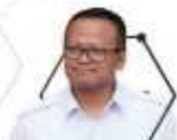
Eddy Prabowo Menteri Kelautan dan Perikanan